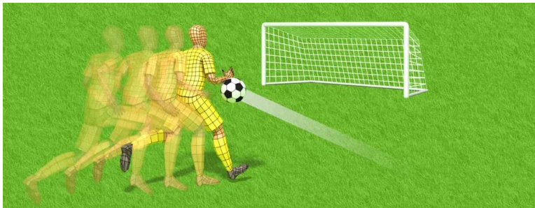
Handspiel vor Torerzielung